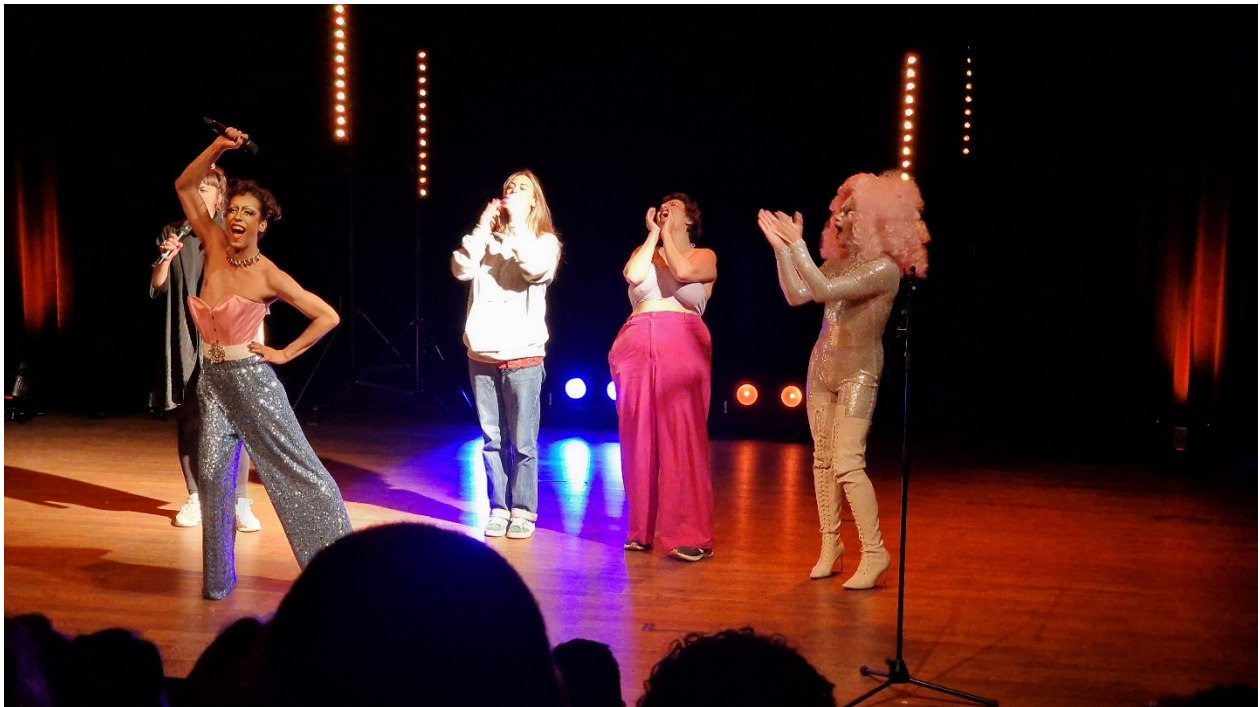
Entre Stand-Up et Show Drag : Plus drôle que lae plus drôle de tes potes !| Soirée de clôture de Féministe Toi-Même ! (Centre Tour à Plomb)

Objectifs : favoriser l'accès à l'art ; donner accès à l'univers d'un artiste et s'ouvrir à des formes inconnues de créativité, s'appropriier des espaces culturels ; permettre aux individus d'exprimer leurs perceptions et leurs ressentis devant des œuvres artistiques ; utiliser l'art comme vecteur de réflexion sociétale.