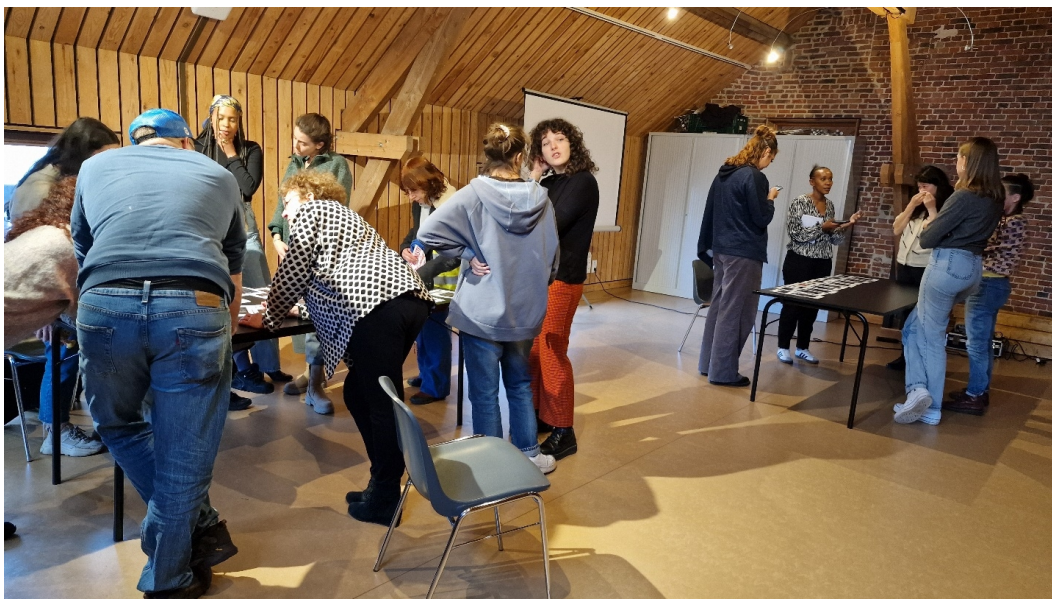
Ateliers à Féministe Toi-Même ! Trois étages en ébullition à la Tour à Plomb...

Les ateliers s'appuient sur toute une série d'outils et méthodologies favorisant l'expression et l'écoute ainsi que les prises de conscience de soi et du groupe. Comme par exemple les cercles de parole du ProDAS, l'expression par la production écrite, la méthode de l'entraînement mental, la spirale dynamique, etc. Ils privilégient aussi l'expérimentation.