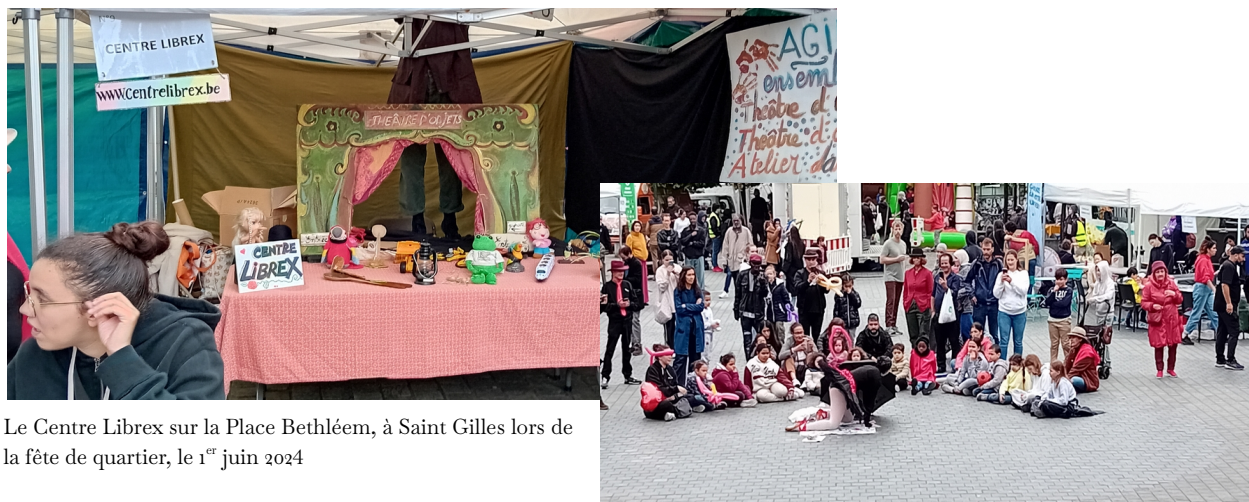
Le Centre Librex sur la Place Bethléem, à Saint Gilles lors de la fête de quartier, le 1 er juin 2024

En matière de communication, nous avons encore à faire évoluer le site internet pour en améliorer la visibilité. Par ailleurs, dans un souci de cohérence avec les réflexions menées au sein du collectif PUNCH, nous nous tournerons progressivement vers des réseaux libres et indépendants – comme Mastodon. Si rester sur les réseaux sociaux populaires comme Facebook ou Instagram nous semble encore aujourd'hui nécessaire pour assurer la promotion de nos activités et rencontrer nos publics, préparer, nourrir et promouvoir une alternative qui garantisse à terme liberté éditoriale et indépendance nous paraît un défi majeur en regard des objectifs que poursuit le secteur de l'éducation permanente.