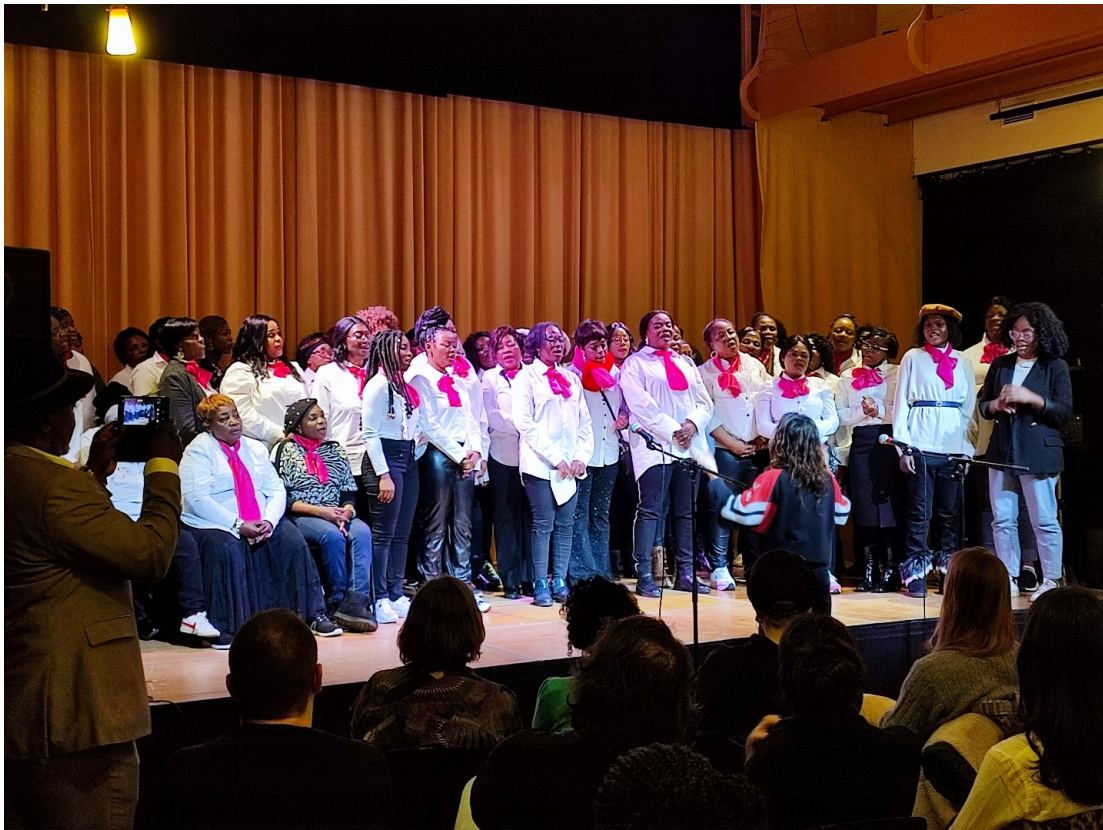
Collectif Chants de Luites – le chœur des femmes sans-papiers (La Maison du Peuple de Saint-Gilles)